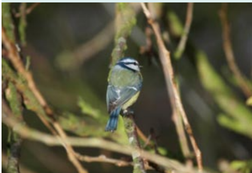
TEKST Tim Krat, naturvejleder og lidflue